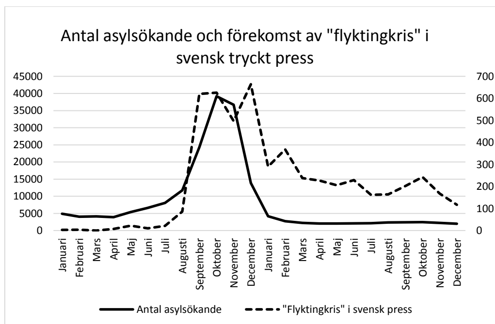
Figur 1. Antal asylsökande i Sverige (hel linje) och förekomst av ”flyktingkris” i svensk tryckt press (streckad linje), per månad, 2015–2016.

Mottagandet av asylsökande i Sverige under 2015–2016 kännetecknas av stora antal asylsökande och ett högt antal handlägningsärenden. Under 2015 sökte 162 877 individer asyl i Sverige, en fördubbling jämfört med året innan (Migrationsverket 2016:15-17). Att fördelningen av antalet asylsökande under året var mycket ojämnt framgår av Migrationsverkets statistik (se figur 1).